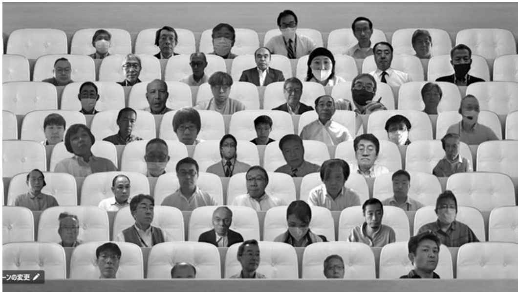
総会にご出席いただきました皆様 ありがとうございます