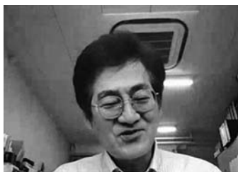
賞状を読み上げる清水会長