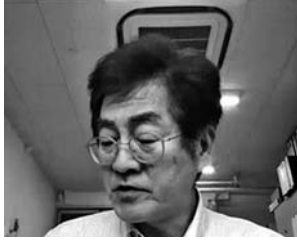
賞状を読み上げる清水会長