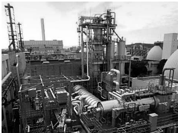
Photo. 1 View of sludge to fuel conversion facilities

施設能力 : 150 ton/日 (脱水汚泥) 計画汚泥処理量 : 46,500 ton/年 (脱水汚泥) 燃料化物製造量 : 約 7,200 ton-DS/年 (製品)